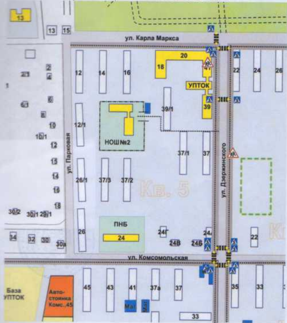
Схема безопасного маршрута движения учащихся по территории, прилегающей к МБОУ НОШ №2 г. Охи